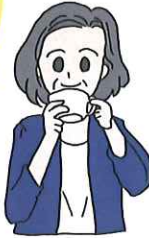
一息つきたいお年頃